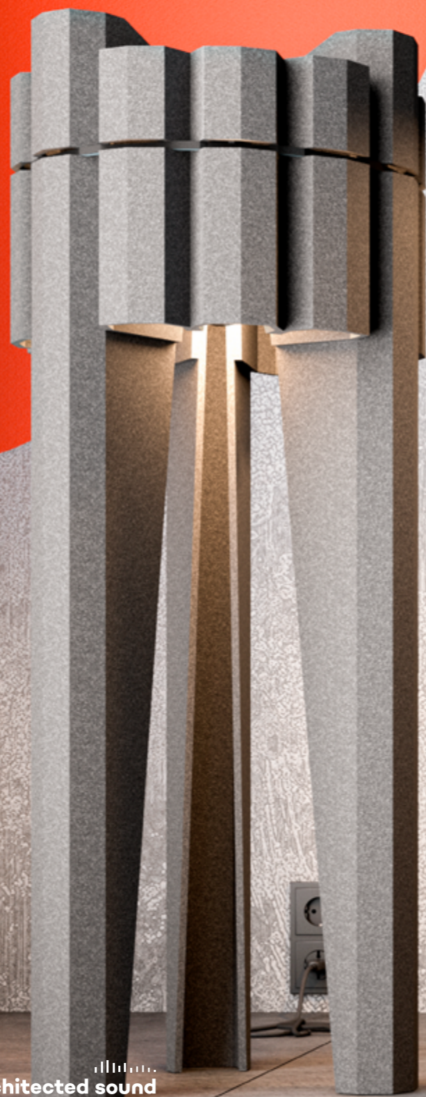
EcoPET the Lamp

Daj się ponieść fantazji i rozjaśnij swoją przestrzeń wielobarwnymi kształtami EcoPET the Lamp!